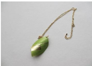
EE15 リーフ チェーン長さ 約45cm ¥2,000