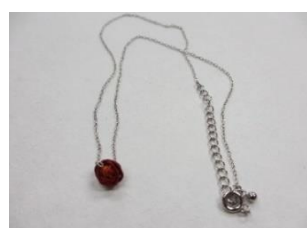
EE17 ボビンフラワー チェーン長さ 約38cm ¥1,500