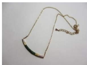
EE16 マカロン チェーン長さ 約45cm ¥2,100 チェーン長さ 約38cm ¥2,000