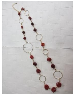
EE22Q コイリングネックレス 長さ 約70cm ¥8,000