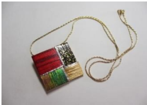
EE11Q ブローチペンダント 井筒 チェーン長さ 約55cm ¥5,000 チェーン長さ 約75cm ¥5,200