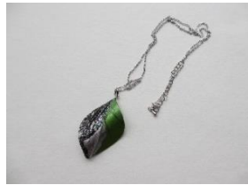
EE20 デコ・リーフ チェーン長さ 約55cm ¥3,000