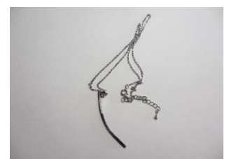
EE19 ウェーブ チェーン長さ 約45cm ¥2,000