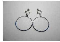
EB61Q COMPO サークル サイズ 直径約40mm ¥2,000