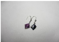
EB60Q COMPO スクエアSS サイズ 約10×10mm ¥2,000