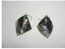
EB68Q COMPO・U・B・I サイズ 約25×25mm ¥4,000