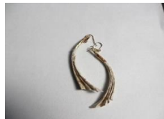
EB66Q COMPO・F サイズ 約50×25mm ¥5,000