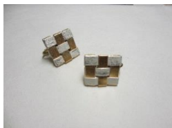
EB72Q コンポジション 千鳥 サイズ 1辺約18mm ¥7,000