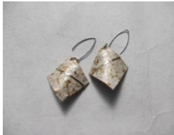
EB67Q COMPO・U・W・I サイズ 約25×25mm ¥3,000