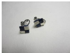
EB71Q コンポジション 千鳥SS サイズ 1辺約12mm ¥3,000

●ひとつずつ手作りで作っておりますので、商品の色調、形状、紙質が若干異なることがあります。