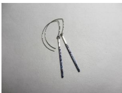
EB65Q コンポジション スリット 大 長さ 約50mm ¥2,300