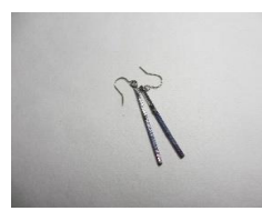
EB64Q コンポジション スリットS 長さ 約40mm ¥2,000