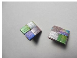
EB69Q COMPO 井筒 サイズ 約20×20mm ¥5,000