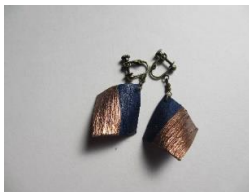
EB63Q COMPO スクエア サイズ 約25×25mm ¥4,500