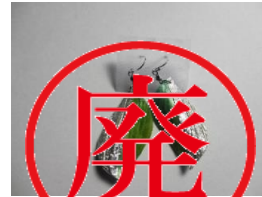
EB69Q COMPO リーフ サイズ 約36×36mm ¥5,000